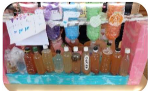
ジュース屋さんでは、外遊びで作った桜の実ジュースを持ち出して並べていました。すごい発想。